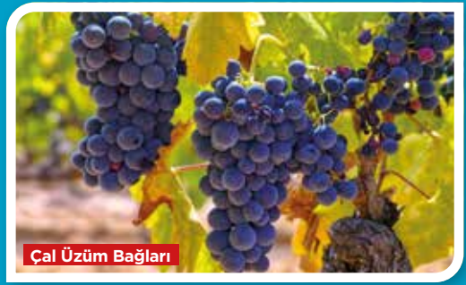
Çal Üzüm Bağları

Horozuyla ünlü bir kent olan Denizli; Pamukkale Travertenleri (Hierapolis Antik Kenti) başta olmak üzere, tarihi İpek Yolu üzerinde bulunan hanlar ve kervansaraylar, antik kentler ve müzelerin yanı sıra her bir ilçesinde görülmeye değer birbirinden farklı doğal güzellikleri ile turizm açısından oldukça zengin bir kenttir. UNESCO'nun dünya kültür mirası listesinde adı geçen Pamukkale, Denizli'nin dünyaca ünlü sembollerinden biridir. Sahip olduğu şifalı Karahayit termal havuzları, kırmızı ve beyaz renkli travertenleri ile Pamukkale mutlaka görülmesi gereken doğa güzellikleri arasındadır.