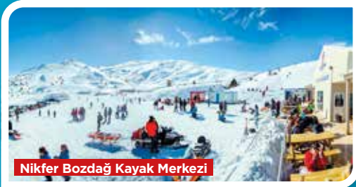
Nikfer Bozdağ Kayak Merkezi