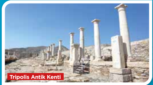
Tripolis Antik Kenti