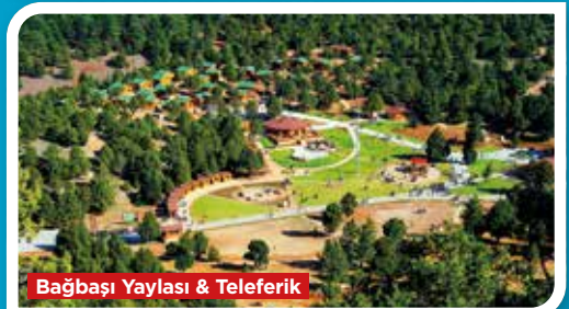
Bağbaşı Yaylası & Teleferik