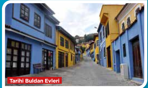
Tarihi Buldan Evleri