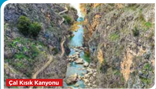
Cal Kısık Kanyonu